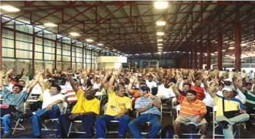
Momento en que el grupo mediador y su asamblea de trabajadores traidores daban el visto bueno a la concesión de los muelles de Limón y Moín a cambio de los 137 millones de dólares

El gobierno de los hermanos Arias en coordinación con el Ministerio del Trabajo, la administración de Junta de Administración Portuaria de la Vertiente Atlántica (JAPDEVA) y el grupo de trabajadores traidores, autodenominado "mediador", desarrollan una fuerte y dura ofensiva en contra de la mayoría de los trabajadores de los puertos de Limón y su sindicato. Los objetivos de esta ofensiva patronal es dar en concesión (privatizar) los dos principales puertos del atlántico (Limón y Moín) a empresas transnacionales, para que los exploten por varias décadas y destruir al sindicato de trabajadores (SINTRAJAP) que se opone a entregar esos puertos en concesión.