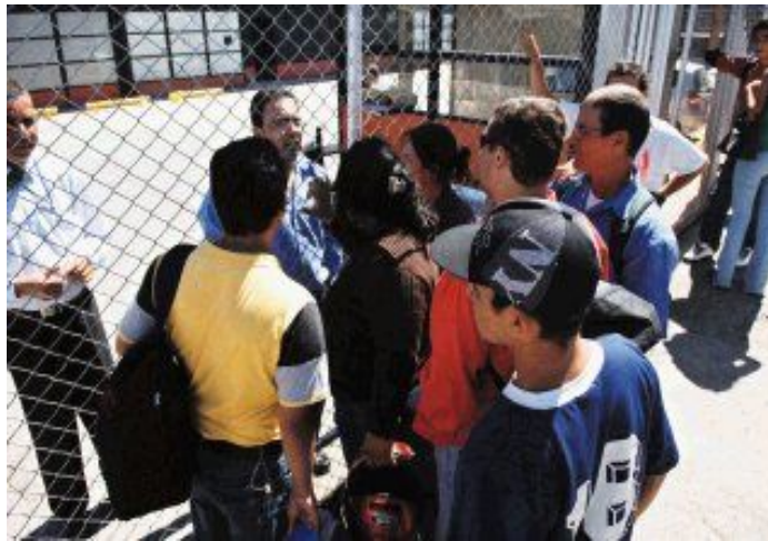
En febrero de 2009, Dominos Pizza se fue del país sorpresivamente y dejó en la calle a 130 trabajadores

La cifra de trabajadores despedidos injustificadamente va en crecimiento porque los empresarios buscan como librarse del pago de