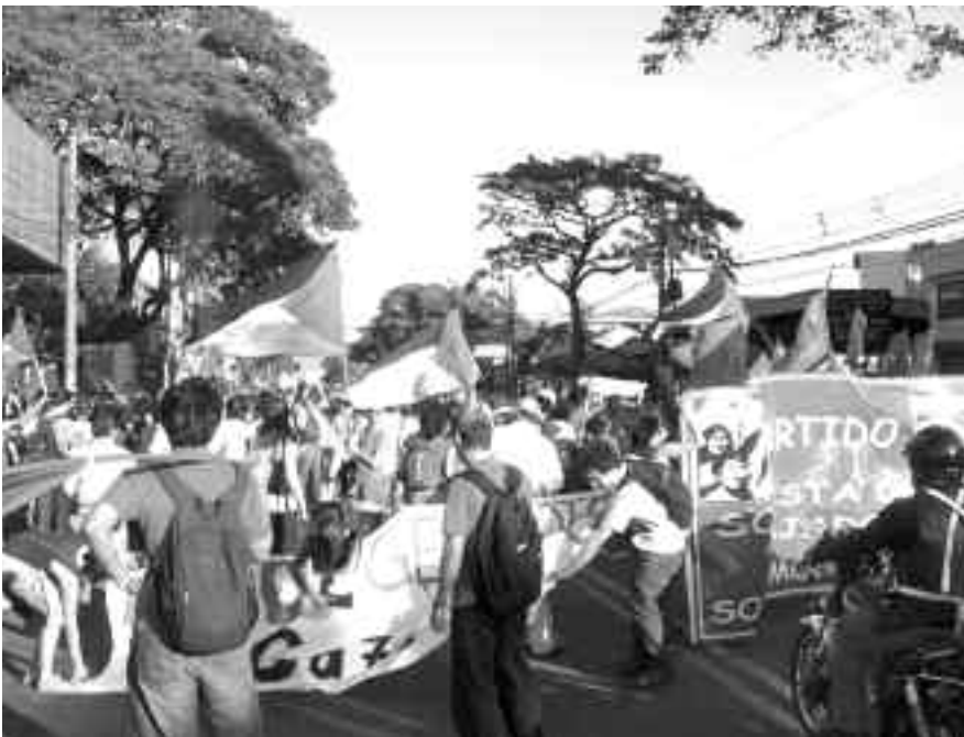
Arriba: Las y los compañeros del Partido Socialista de las y los Trabajadores, de Costa Rica, en la marcha en San José en solidaridad con Palestina y contra la agresión sionista.

Para finalizar, el Comité acordó convocar una movilización para este martes 20 de enero frente a la embajada de Estados Unidos como una forma de protestar contra la complacencia del imperialismo norteamericano en la intervención armada israelí y para señalar como el nuevo presidente gringo Barack Obama ha sostenido un silencio cómplice a los ataques, dejando claro que su nuevo gobierno será más de lo mismo.