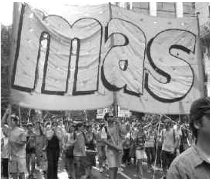
Abajo: la columna que formó el nuevo MAS en la multitudinaria marcha en Buenos Aires el 6 de enero.