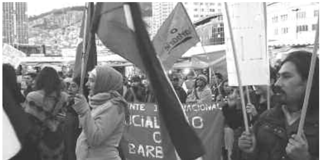
Arriba: En el centro de La Paz, los compañeros de Socialismo o Barbarie Bolivia fueron parte del acto solidario del jueves 10 donde los trabajadores y el pueblo boliviano expresaron su condena al genocidio sionista.