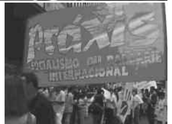
Derecha: El 13 de enero, se realizó en San Pablo, una gran manifestación de apoyo al pueblo palestino y en repudio al estado genocida de Israel. Los compañeros de Praxis, la organización de Socialismo o Barbarie en Brasil, estuvieron entre las organizaciones que llevaron su solidaridad.