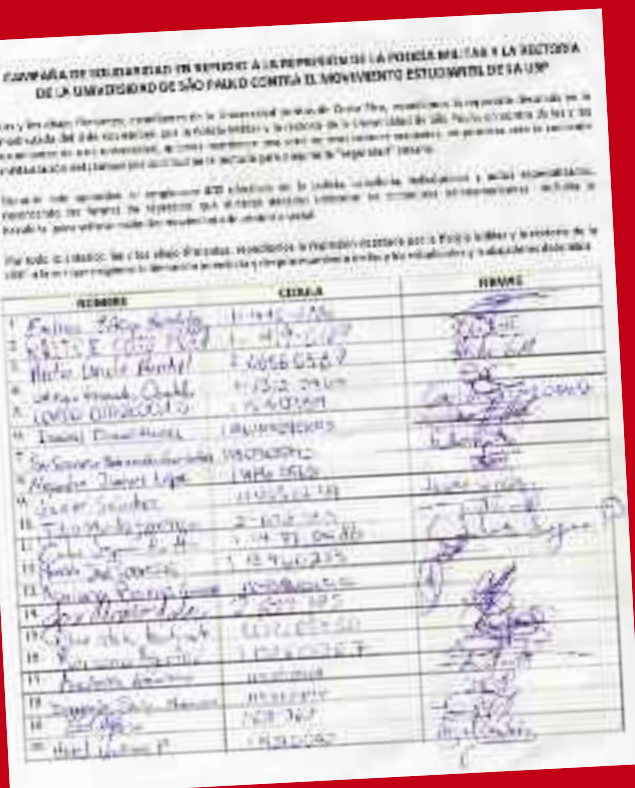
Petitorio impulsado en Costa Rica

Desde la Juventud Socialista y Las Rojas de Costa Rica, miembros de la Corriente Socialismo o Barbarie, impulsamos una campaña de solidaridad entre activistas estudiantiles de la Universidad de Costa Rica, Universidad Nacional y la Universidad Veritas, repudiando las acciones represivas de la Policía Militar y la rectoría de la Universidad de Sao Paulo el pasado martes 8 de noviembre, donde resultaron detenidos 73 estudiantes -entre estos una compañera de nuestro grupo hermano Praxis-, quienes ocupaban las instalaciones del rectorado de la USP en protesta ante la militarización del campus universitario. En el caso de Costa Rica, durante el 2010 tuvimos que afrontar una situación similar, pues el 12 de abril de ese año, la Universidad de Costa Rica fue, literalmente, invadida por un cuerpo de 70 oficiales del Organismo de Investigación Judicial, en una clara muestra de irrespeto a la autonomía universitaria. Fruto de este ataque a la autonomía, el movimiento estudiantil salió a enfrentar la invasión policial, con el saldo de varios compañeros detenidos. Desde una perspectiva más de conjunto, la actual pelea estudiantil en Brasil no es un hecho aislado, sino que forma parte de un proceso de creciente movilización entre sectores de la juventud, y para el caso específico