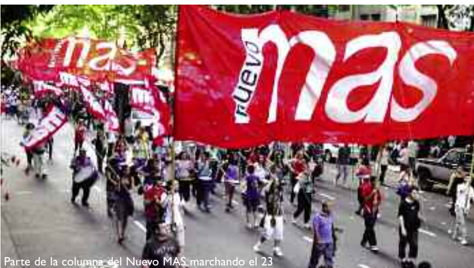
Parte de la columna del Nuevo MAS marchando el 23

Tanto es así que dio un paso más en este sentido, cuando se encargó de darles tranquilidad a las grandes patronales para que envíen sus suculentas ganancias a las casas matrices, léase, cobrar en Argentina pero guardarlas (en