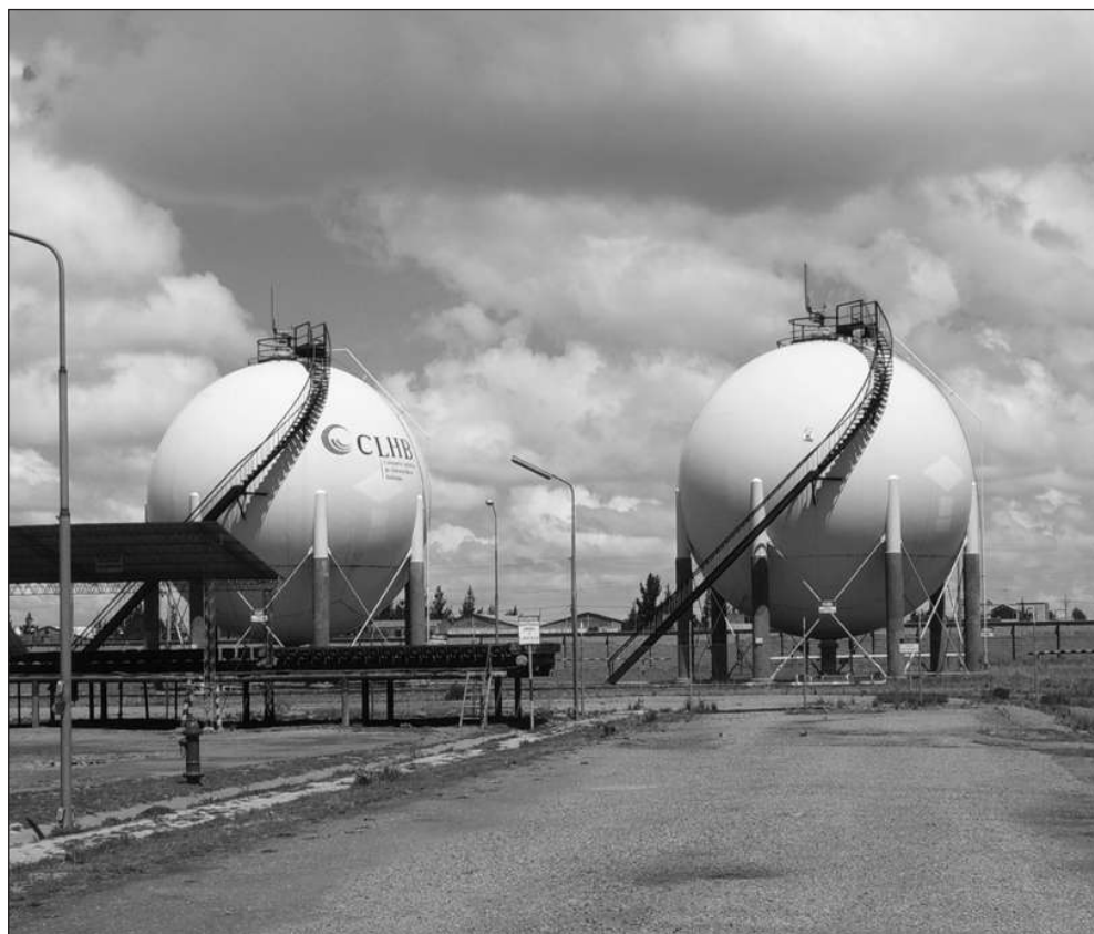
Esta es una planta almacenadora de productos hidrocarburíferos procesados. Ésta se encuentra ubicada en Senkata y pertenece a la transnacional CLHB.