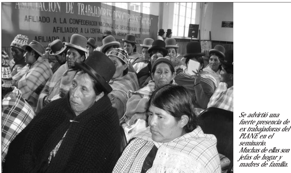
Se advirtió una fuerte presencia de ex trabajadoras del PLANE en el seminario. Muchas de ellas son jefas de hogar y madres de familia.