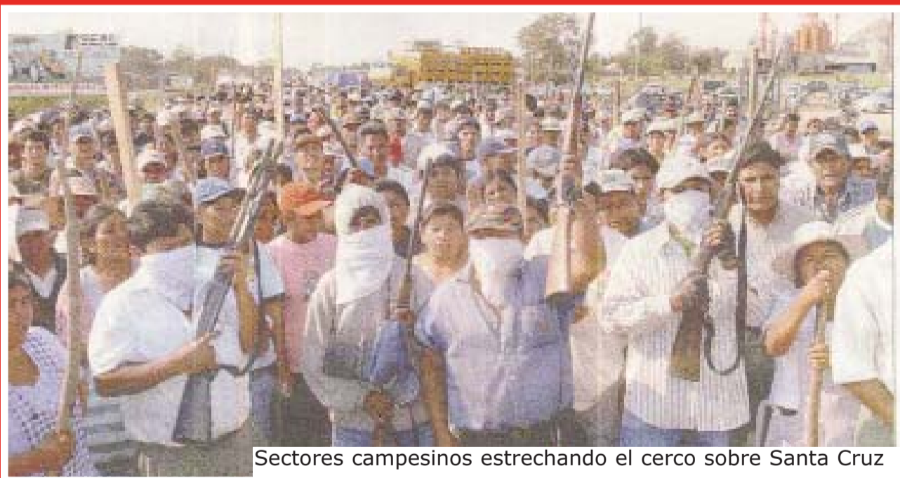
Sectores campesinos estrechando el cerco sobre Santa Cruz

CON LOS FASCISTAS NO SE DISCUTE, SE LOS APLASTA