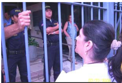
Las puertas cerradas recibieron a los docentes