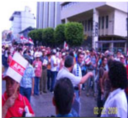
Movilización del 22

Además el MEP prorrogó sus nombramientos políticos del 2007, duramente criticados por la prensa burguesa, luego de anular arbitrariamente el último concurso dejando a miles de educadores sin posibilidad alguna de nombramiento en pro-