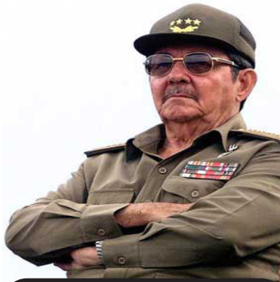
Raúl Castro Ruz

Por el contrario, un amplio sector del capitalismo mundial, menos ruidoso pero más eficaz, actúa desde hace mucho tejiendo las condiciones para que, en Cuba, la tan mentada “transición” reproduzca las vías de negociaciones y acuerdos con las burocracias, que jalonaron las restauraciones capitalistas en la mayoría de los ex “países socialistas”, desde Hungría hasta China.