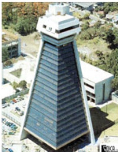
Contraloría General de la República

Este razonamiento es una verdadera muestra del manejo burocrático