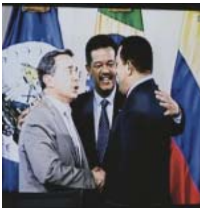
Chávez y Uribe en fraternal saludo

De esta forma el escenario estaba servido para que se desarrollara propiamente la Cumbre Presidencial. Ahora, ¿cuál fue el resultado de la crisis, de las tensiones políticas, de los "diferentes sistemas de pensamiento en juego"? Pues a decir verdad y procurando extraer una conclusión marxista deberíamos decir que todo terminó en una FARSA!!! En un abracito cursi de parientes arrepentidos por la alharaca desatada. Sí, la crisis diplomática finaliza con Hugo Chávez abrazando a Álvaro Uribe, es decir brindándole un gesto afectivo al asesino títere de Bush para Latinoamérica. De la misma manera Uribe realiza la firme promesa de no invadir más a países vecinos y estrecha afectuosamente la mano de Correa, Chávez y de Ortega.