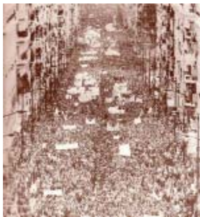
Mayo de 1886, Chicago.

En mayo de 1886 miles de trabajadores se movilizaron en las calles de importantes ciudades estadounidenses en su lucha por conseguir la jornada de 8 horas. Días después de una gran movilización callejera en Chicago, esta desencadenó varios días de huelga. Miles de trabajadores lograron la conquista de las 8 horas, mientras otros cientos fueron despedidos y violentados salvajemente por las fuerzas represoras. Hubo muertos y muchos heridos.