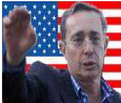
Uribe, Títere de Bush

apuntaban hacia un enfriamiento de los acontecimientos y un restablecimiento de la normalidad al interior de todos estos Estados Burgueses en disputa.