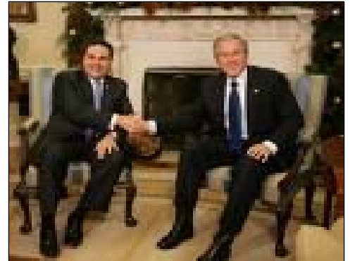
Antonio Saca en una reunión con su superior inmediato: Bush

Tal y como se desprende de esta cita, el modelo de exportaciones salvadoreño ha resultado un negocio rentable para la oligarquía cuscatleca. Pero caso contrario es la situación que cotidianamente enfrenta el pueblo trabajador salva-