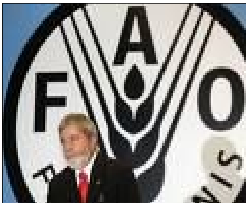
Lula: de dirigente sindical a compinche del FMI y el BM

A su vez, el BNDS (Banco Nacional de Desarrollo Social) pasó de 19.000 millones de reales en 1998 a la descomunal cifra de 65.000 millones de reales en 2007, beneficiando principalmente a las montadoras de autos, que compensan la baja de las exportaciones –por la