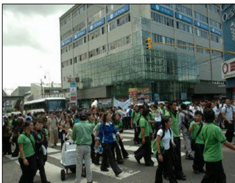
Los alrededores del edificio del MEP fueron tomados por cientos de estudiantes

mero que se les puso en frente, pero bueno... son las políticas de nuestro gobierno ¿qué se puede hacer?