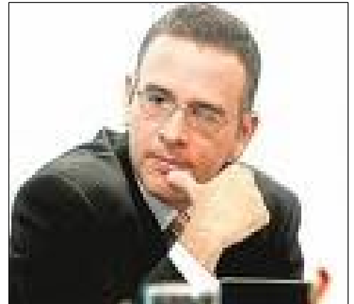
Mauricio Funes, candidato presidencial por el FMLN

Hasta su reciente muerte, el ex comandante guerrillero Shafick Handal, fue la principal figura pública del FMLN. Esto significó que por más moderado que fuese el programa que esta agrupación levantara, siempre persistiera la imagen del