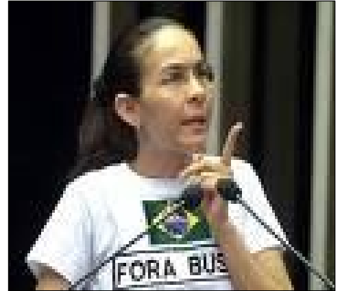
Heloisa Helena, principal figura del PSOL

será aún más dramática. Además, el PSOL profundiza su carácter de partido inorgánico, con una base despolitizada y una dirección totalmente adaptada a la lógica electoral .