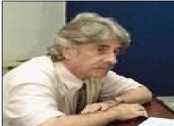
Las cúpulas sindicales se rehúsan a luchar a fondo contra el MEP por una justa remuneración salarial a las y los docentes

única vez en enero del 2008. Las bases de APSE y ANDE, fundamentalmente vieron con recelo dicha propuesta, sobre todo que estaba en ciernes la lucha por la equiparación, y vieron con buen instinto, que dicho ofrecimiento podría ser una maniobra para usar ese 14% como parte de una futura negociación. Las bases insistieron para que dicho porcentaje quedara fuera del salario base real, pero las dirigencias hicieron caso omiso y formaron el acuerdo sin ninguna salvaguarda para futuras negociaciones.