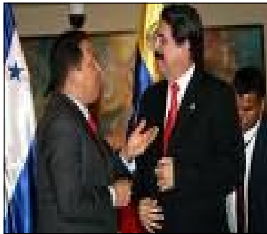
Mel Zelaya y Hugo Chávez ahora son aliados políticos

Esta mayor presencia del chavismo en la región está generando un interesante