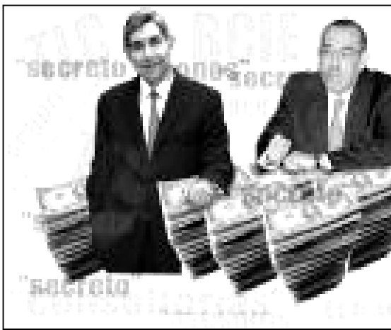
Los Arias montaron su propia piñata con los Bonos Chinos y el BCIE

Todos los hechos y situaciones antes planteadas, así como otros no comentados, se inscriben en una serie de acontecimientos, en los cuales los hermanos Arias, actuando por encima de la llamada “institucionalidad democrática” , sacrosanta por la oligarquía e impuesta por esta para evitar ser burlada por los gobiernos de turno, intentaron hacer variaciones en el tipo de régimen, otorgándole y desplazando más poder al ejecutivo del que verdaderamente tiene. Al final, la