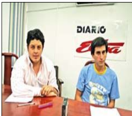
Representantes de Reacción Universitaria han denunciado que la FEUCR "gira" dineros para los sindicatos

Este anterior sería el marco general, ahora entrémole a la polémica. Ésta inicia cuando el estudiante