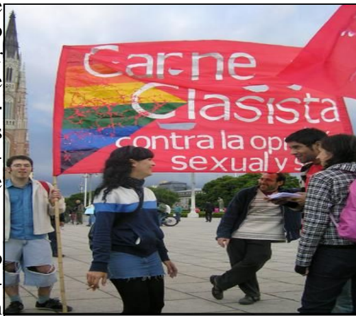
Para Carne Clasista, la lucha por los derechos de la minorías sexuales está vinculado con las peleas de las y los trabajadores.

En relación a la historia de Carne Clasista, tiene que ver con experiencias que surgen al calor del Argentinazo . En la rebelión popular de diciembre del 2001 junto a las asambleas populares, organizaciones de trabajadores desocupados, surgen también nuevos grupos GLTTB, con una impronta antica-