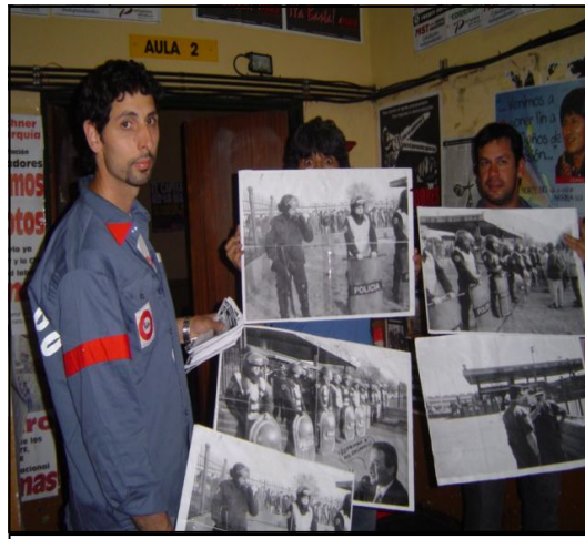
Compañeros despedidos de FATE, mostrando fotografías de cuando la fábrica estuvo militarizada

M: Todas las denuncias fueron hechas, pero algo las trababa. Todo esto (condiciones laborales) desarrolló la lucha. Sólo a través de la lucha fue la única vez que se rom-