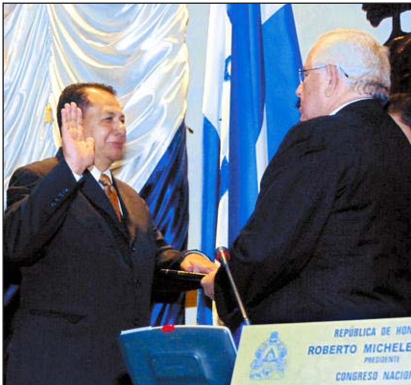
■ Nuevo fiscal general, más de lo mismo

En conclusión, la Junta Nominadora está y estará siempre contaminada por los partidos tradicionales y por ello, es casi imposible que logre el propósito para el cual fue creada: lograr una Corte Suprema de Justicia independiente de los partidos tradicionales y de los grupos políticos. Ante esto, considero que la participación de las Centrales Obreras y de la Sociedad Civil sólo servirá para legitimar un proceso en donde los partidos tradicionales son los que decidirán la elección de los Magistrados que respondan a sus intereses partidarios y económicos. Por tal razón, deben retirarse de esa Junta y luchar por una verdadera reforma constitucional, mediante la cual se pueda elegir una Corte Suprema de Justicia integrada por todos los sectores del pueblo; que garantice realmente el acceso a la justicia a los pobres y pueda enjuiciar y encarcelar a los corruptos que saquean el Estado, ya que sólo de esta forma se podrá lograr un verdadero cambio en la impartición de justicia. Cabe resaltar el descaro de los Liberales y Nacionalistas al elegir en las casas de sus máximos líderes y no en el Congreso Nacional a sus Magistrados, y llegar minutos antes de la hora pico al Congreso sólo a ratificar el vergonzoso ocho a siete. En conse-