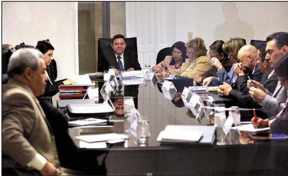
■ Pleno de nuevos magistrados liberales y nacionalistas