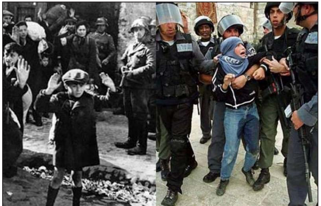
• A la izquierda, niño judío rodeado de tropas alemanas. A la derecha niño palestino rodeado de soldados israelitas para desalojarlo junto a su familia de sus tierras.

El desenlace ha provocado una crisis política en Israel , donde el principal partido opositor, el Likud, encabezado por Beniamín Netanyahu, ha hecho un escándalo por la retirada unilateral. Aunque hay allí una minoría que valientemente se opuso a la guerra, la mayo-