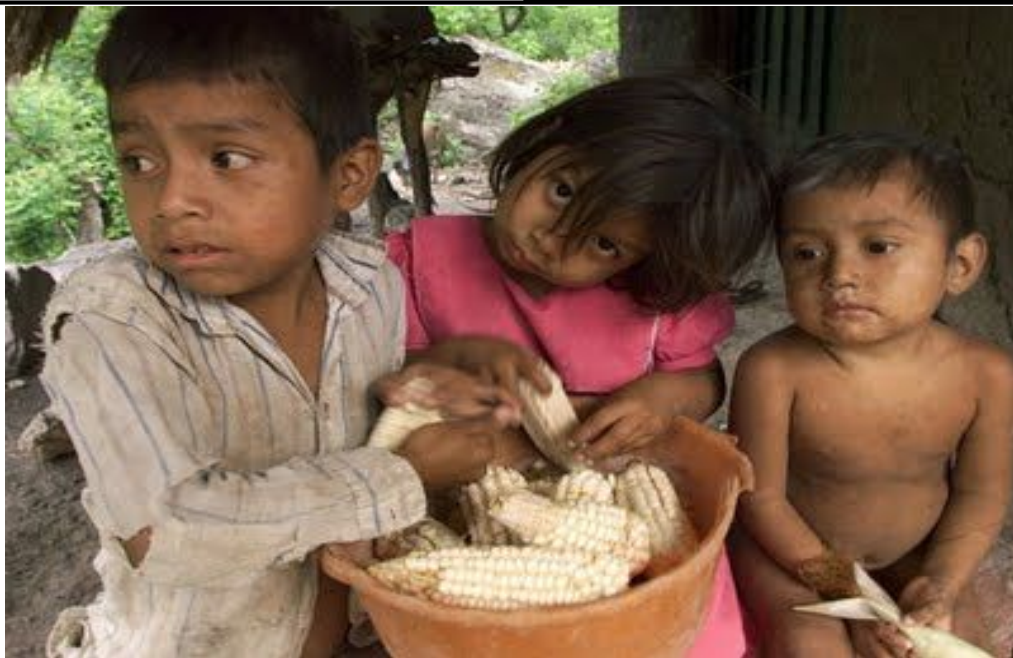
Las y los niños indígenas son los principales afectados por la hambruna.

En gran medida, esto nos permite comprender la poca previsión al respecto que tuvo el gobierno de Colóm -que reproduce la visión racista-patriarcal-capitalista de sus antecesores-, quien tan sólo se ha limitado a realizar una declaración de “calamidad pública”, pidiéndole a la población guatemalteca que done alimentos y