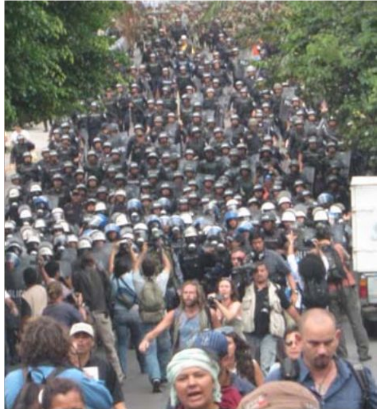
Fotografía de la marcha del 28 de setiembre en Tegucigalpa.

2. La declaración del estado de sitio con suspensión de garantías. El estado de sitio, si bien es desafiado, no lo es por el movimiento de masas movilizadas sino por la vanguardia. La situación la ilustra bien esta foto de la marcha del lunes 28 de septiembre [ver foto]. Parecía una marcha de la policía y los