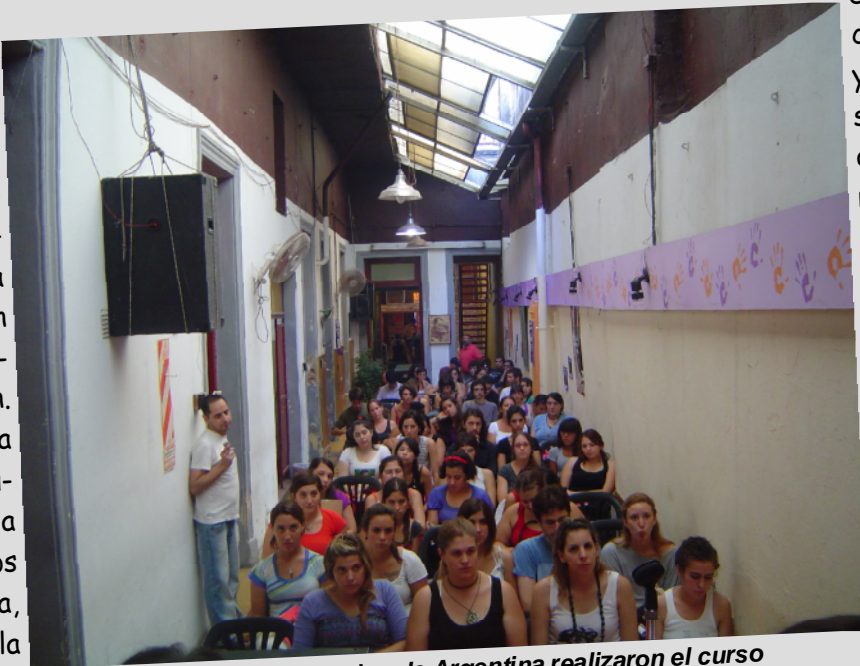
Del 9 al 14 de marzo Las Rojas de Argentina realizaron el curso "Historia de la lucha de las mujeres", al cual asistieron más de cien compañeras y compañeros.

Desde el socialismo revolucionario, como nuestra idea y nuestra lucha es emancipar a la sociedad de toda forma de opresión, queremos acabar con todo tipo de opresión racial, sexual, étnica, nacional, del tipo que fuese.