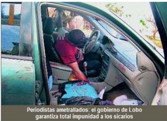
Periodistas ametrallados: el gobierno de Lobo garantiza total impunidad a los sicarios