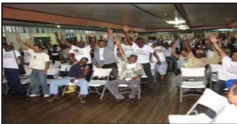
Asamblea de SINTRAJAP del 4 de marzo, cuando cerca de 600 trabajadores votaron contra la propuesta del gobierno para privatizar los puertos de Limón

El día viernes 26 de febrero, la directiva anterior y legalmente constituida intentó montar una asamblea de trabajadores para revertir el golpe propinado por el gobierno en contubernio con sus testaferros, pero no lograron el quórum debido al boicot y atemorización que