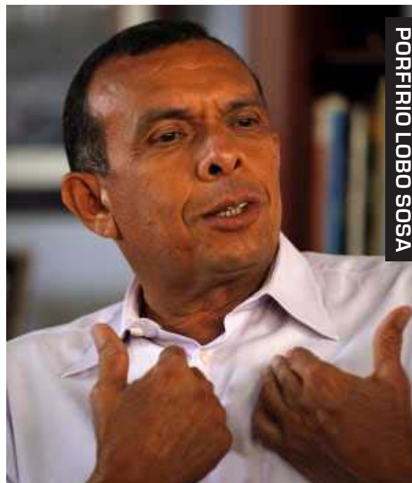
PORFIRIO LOBO SOSA

MANUEL FLORES HASTA EL SOCIALISMO SIEMPRE