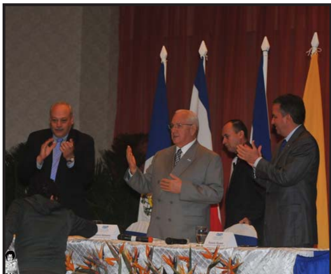
En el gobierno de Micheletti se inició la “Visión de País”

por eso tampoco recuerdan los nombres de los asesinados bajo su régimen represor.