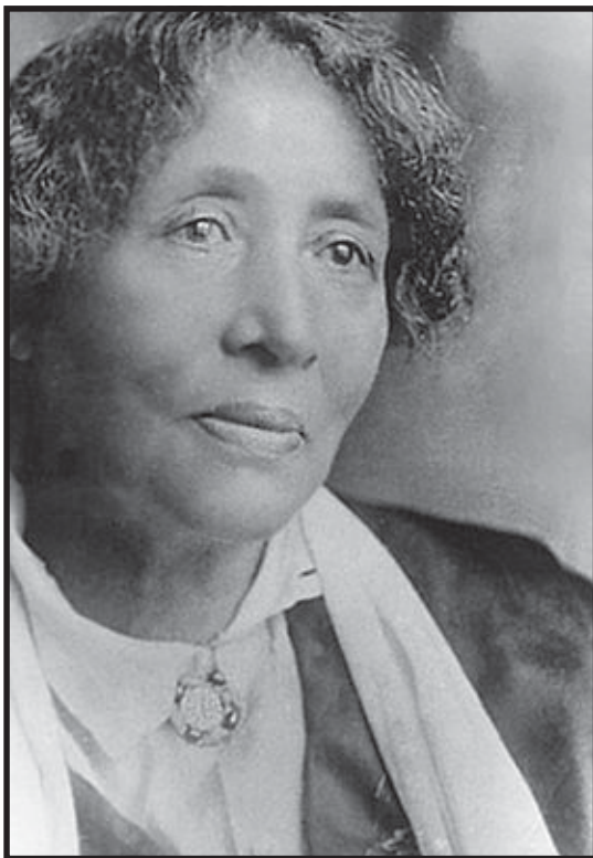
Somos las esclavas de los esclavos. Nos explotan más despiadadamente que a los hombres. (Lucy González de Parsons, 27 de junio de 1905).

"Mi concepción de la huelga en el futuro no es una paralización que a su fin la gente se van a su casa volviendo a sus hogares hambrientos, sino una huelga en que todos se mantendrán de paro y tomarán los medios de producción necesarios para sí". Lucy Gonzalez Parsons]