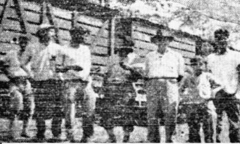
La huelga bananera de 1934 fue determinante para potenciar al proletariado bananero como columna vertebral del movimiento obrero costarricense hasta la guerra civil de 1948.