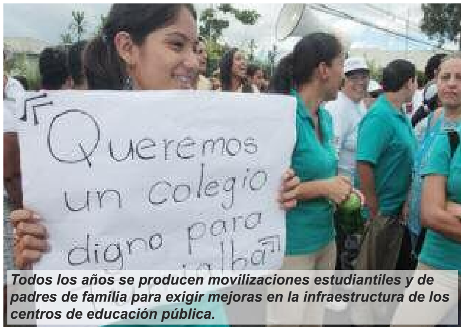
Todos los años se producen movilizaciones estudiantiles y de padres de familia para exigir mejoras en la infraestructura de los centros de educación pública.

1. Obra u ocupación que se ajusta por un tanto alzado, a diferencia de que se hace por jornal. Diccionario de lengua española. 2001, Colombia. Alzado: Dicho de un ajuste o de un precio: Que se fija en determinada cantidad, a diferencia de los que son resultado de evaluación o cuenta circunstanciada.