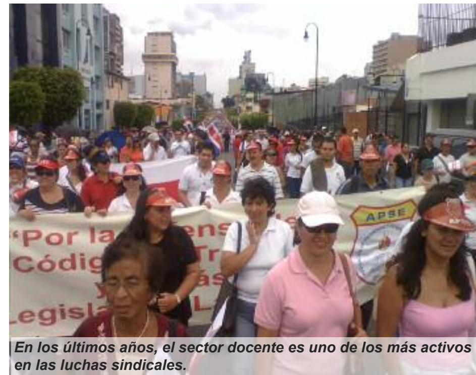
En los últimos años, el sector docente es uno de los más activos en las luchas sindicales.

nibles, “El porcentaje de deserción en secundaria disminuyó en 1,2 puntos porcentuales en relación con el 2008 (de 12,1% a 10,9%), con lo cual se acercó a una de las cifras más bajas reportadas desde 1995” (Estado de la Nación, 2010: 88). Sin embargo, la problemática de la deserción continúa siendo grave en los niveles de séptimo, así como en algunas regiones del país. En el año 2009, la deserción en séptimo año se ubicó en el 17,8% para un total de 17 909 estudiantes. La expulsión, por parte del sistema educativo, de estudiantes de ese nivel se ubica desde el 11,4% en Turrialba hasta el 34,4% en Sarapiquí. En el año 2010, la deserción bajó al 10,2%, es decir un 0,7%, para un total de 35 503 estudiantes, o sea que no fueron excluidos 1 707 alumnos.