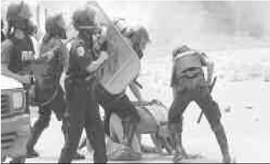
En 2003 la Fuerza Pública reprimió una huelga de los trabajadores del muelle de Moín, y luego tomó control de las instalaciones

En la edición anterior de Prensa Socialista iniciamos este artículo sobre los alcances de la Reforma Procesal Laboral, haciendo énfasis en el uso del derecho a huelga a lo largo del siglo XX. En esta segunda parte nos dedicaremos a analizar el proyecto como tal, en particular lo concerniente al derecho a huelga.