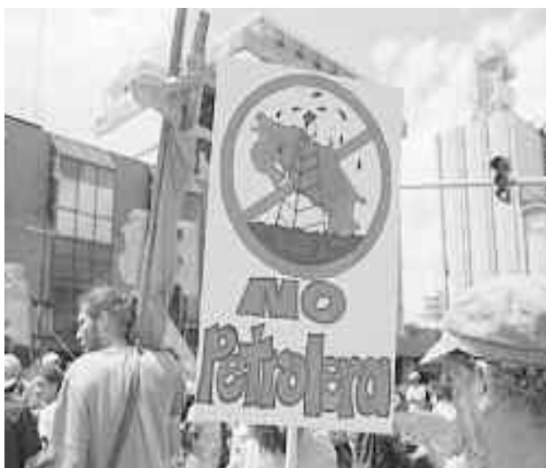
Marcha antipetrolera realizada en San José, el 11 de junio anterior