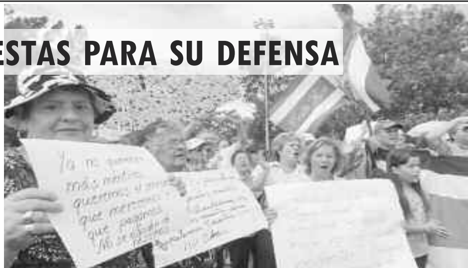
Marcha comunal en Tibás en protesta por el cierre de servicios médicos en la oficina regional del EBAIS.

Desde el Partido Socialista de las y los Trabajadores consideramos que la defensa