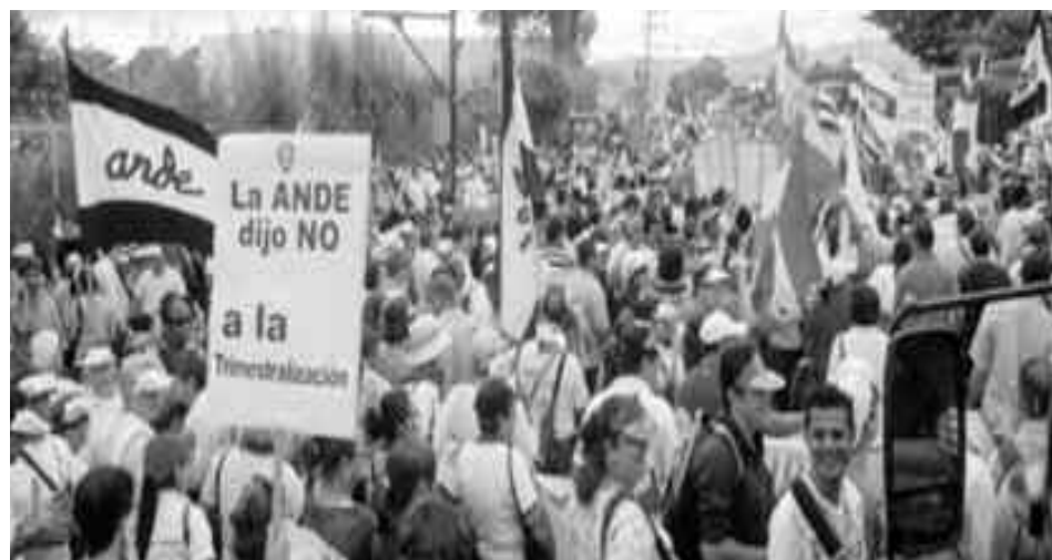
Docentes en la marcha contra la trimestralización del curso lectivo

Pero dado el carácter universal de los servicios que brindan este tipo de empresas o su proyección social hacia las comunidades, una eventual pelea por su defensa puede trascender el plano meramente sindical y articular sectores