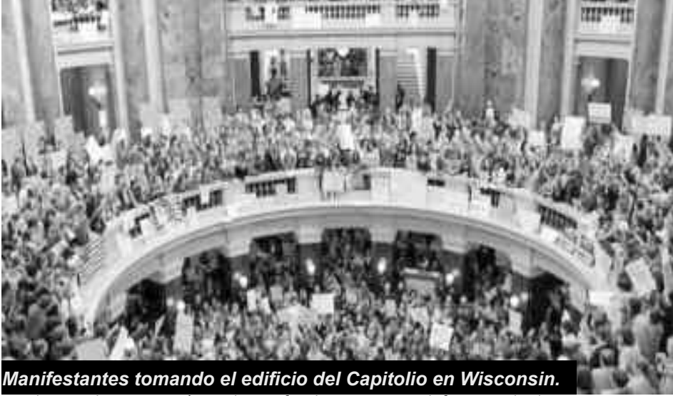
Manifestantes tomando el edificio del Capitolio en Wisconsin.

que la actual crisis económica ha profundizado las problemáticas estructurales del capitalismo imperial agudizando la crisis social y deteriorando de manera significativa las condiciones de vida de las clases sociales no hegemónicas.