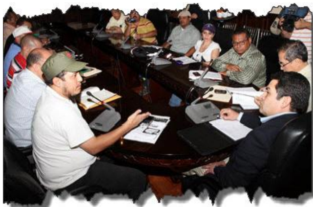
Interminables mesas de concertación

Los acuerdos de las diferentes asambleas que apuntaban a la lucha directa contra el régimen fueron dejados de lado ( Posicionamiento político de la declaración de Siguatepeque, febrero 2010) o reemplazados con caminatas, tomas improductivas, paros cívicos mal preparados, negativa a realizar la Huelga General y acciones vanguardistas para provocar el desgaste de las luchas. Mientras el régimen unificaba su estrategia combinando la demagogia con la represión, para aislar, desmovilizar y derrotar las luchas, la Coordinación General del FNRP – encabezada por Manuel Zelaya–, conscientemente separó la lucha reivindicativa social de la lucha política dejando a los gremios enfrentando solos al régimen. Las consecuencias fueron el abandono de los trabajadores, la derrota del magisterio, los golpes al SITRAUNAH y al SITRAINAH y el aislamiento de los campesinos del Aguán que en medio de la feroz represión del “operativo