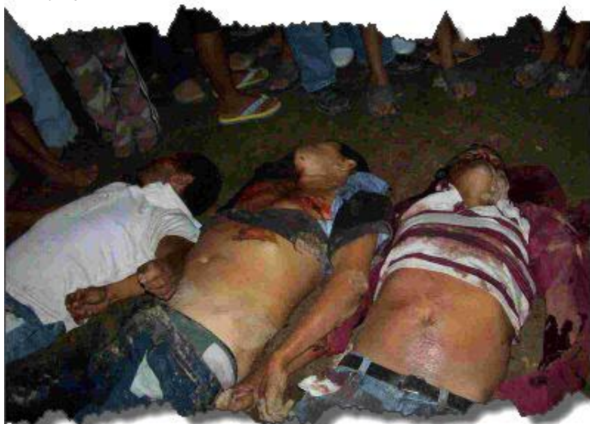
Medio centenar de asesinatos en el Bajo Aguán

tivo del MUCA, se lamentó que “el operativo Xatruch II impulsado por el régimen de Porfirio Lobo no sólo no está resolviendo el grave conflicto agrario que hay en la zona del Valle del Aguán, sino que lo está profundizando”.