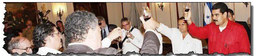
Brindando por la reconciliación

La carta, ampliamente divulgada por los voceros oficiales del FNRP, es la continuación y profundización de la política de “reconciliación” que Zelaya viene impulsando desde la firma del Acuerdo de Cartagena y favorable a un dialogo con el régimen, en contra de los acuerdos del FNRP y del sentimiento