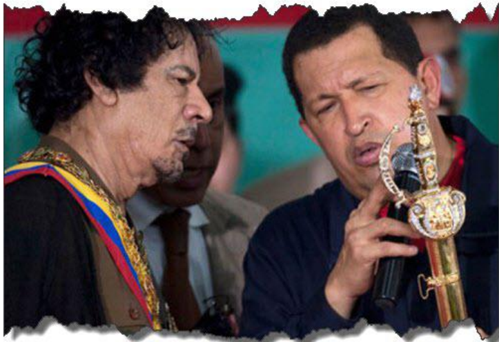
Gadafi y Chávez

Los negocios e intereses petroleros comunes con Gadafi, llevaron a Chávez a consagrarlo como otro Bolívar, algo que no puede menos que asombrar a cualquiera que conozca mínimamente a ambos personajes. Pero esto no es novedoso en relación a Chávez. De la misma manera, los negocios e intereses comunes con el estado y la burguesía colombiana lo llevaron al pacto con su nuevo presidente, Santos. Sus