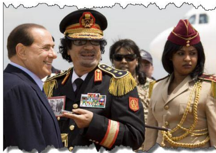
Berlusconi y Gadafi

No es necesario subrayar el papel fundamental que los imperialismos europeos juegan en relación a Libia y a todo el proceso de la “Primavera Árabe”. Dada la situación política europea, teñida por el descontento creciente debido la crisis y los “planes de austeridad” neoliberales, las protestas contra estas nuevas aventuras coloniales habrían sido un obstáculo serio. Pero el imperialismo logró confundir a amplios sectores obreros y populares de Europa