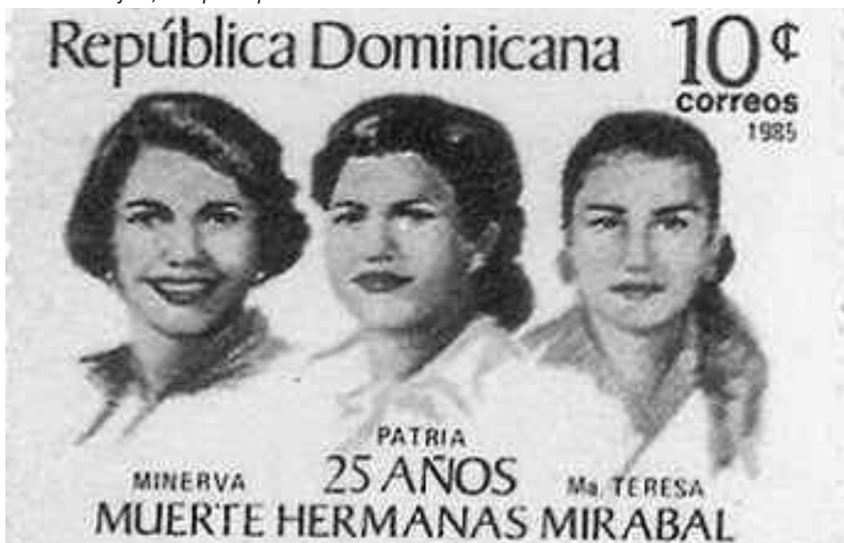
Estampilla postal en homenaje a las hermanas Mirabal.