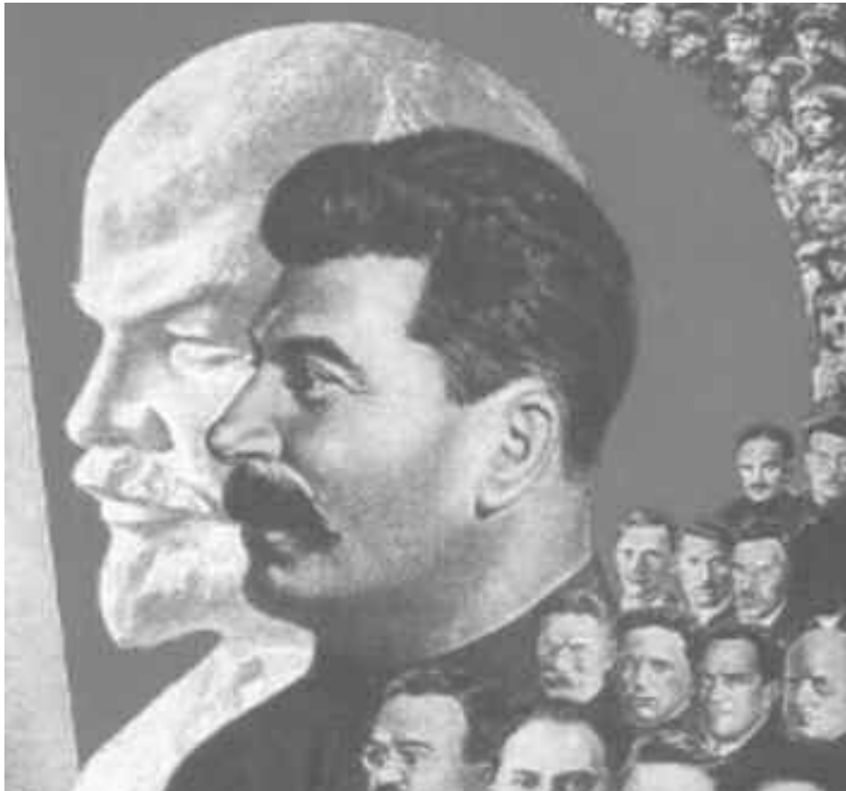
La burocracia estalinista creó un culto a la personalidad de Josef Stalin, al cual "convirtieron" en el heredero del leninismo, para capitalizar el prestigio de la revolución rusa y garantizar la consolidación de su control burocrático del Estado soviético.

aquella década aciaga, la bien llamada "noche del siglo XX". Porque contra viento y marea, contra la acción conjunta del estalinismo, la socialdemocracia y las potencias imperialistas que hicieron de él una persona sin visa de ingreso en ningún país, tuvo el valor y la capacidad de dar continuidad a la tradición del marxismo clásico y revolucionario. Correspondió a Trotsky, y al puñado de revolucionarios socialistas en torno a él, el haber puesto los cimientos y llevado a cabo la fundación de la IV Internacional.