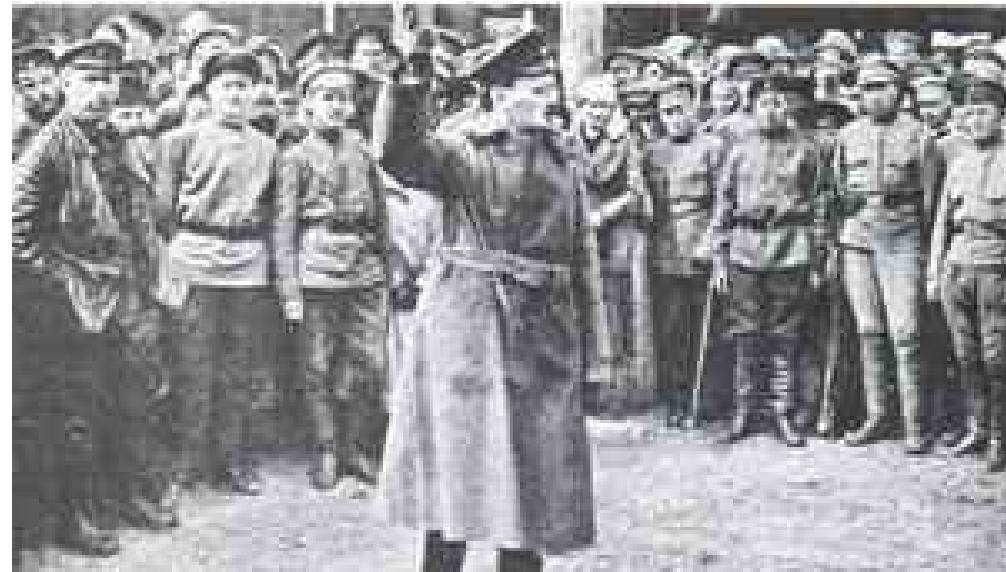
Durante la Guerra Civil, Trotsky jugó un papel fundamental en la construcción y dirección del Ejército Rojo.

Inversamente, la resistencia a la ocupación nazi en los países de Europa occidental recayó sobre las fuerzas “socialistas”. Y cuando Alemania se rinde, el escenario en Francia, en Italia y otros países, estaba ocupado por ellas. Otra vez, como al fin de la guerra mundial anterior, un sudor frío recorrió los frentes del gran capital: ¿es que acaso la derrota de Hitler