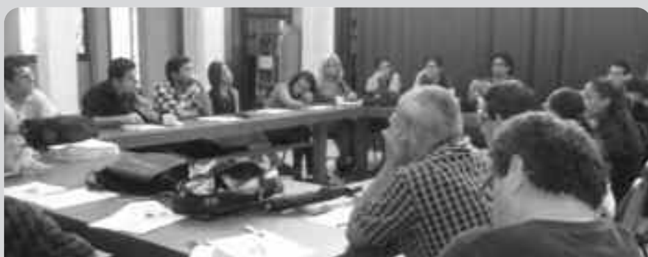
La sesión de conformación de la ACOPROFILO se realizó el 15 de octubre, a la cual asistieron docentes y estudianties de Filosofía