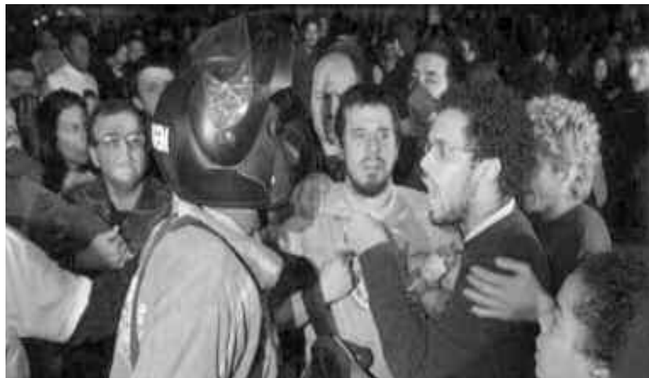
El martes 8 de noviembre la Policía Militar ingresó al campus de la USP, donde reprimió al movimiento estudiantil y detuvo a 73 personas, entre ellos una compañera de Praxis, grupo de SoB en Brasil.

Es que la USP tiene gran tradición de lucha; ha realizado varias huelgas estudiantiles en los últimos años; y el gobierno estadual del PSDB, viene tratando de liquidar estas características combativas mediante un plan reaccionario de "normalización" de la universidad.