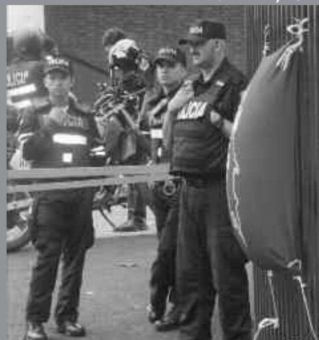
En la imagen se aprecian los policías enviados a "cuidar" la imprenta durante la huelga, síntoma inequívoco del endurecimiento del gobierno para garantizar el ajuste fiscal.

La negativa del gobierno por garantizar el cumplimiento de esta Convención Colectiva, hace parte de su política de ajuste fiscal para enfrentar las repercusiones de la crisis mundial en el país, donde los recortes presupuestarios son dirigidos contra las condiciones laborales de las trabajadoras y trabajadores, al mismo tiempo en que se impulsa la aprobación de un plan fiscal que aumenta el cobro de impuestos indirectos sobre el consumo, con lo cual