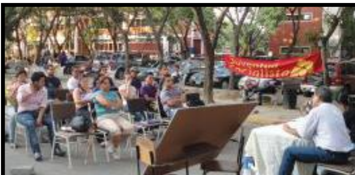
↑ En la teoría y...