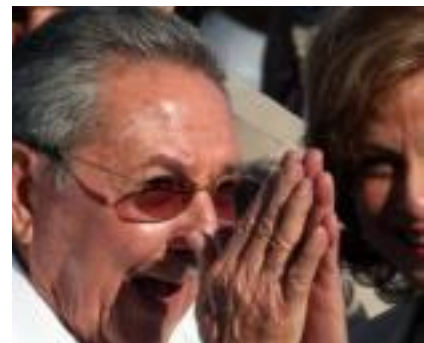
↑ Raúl Castro

Quizás por todo esto, el Gobierno cubano no mostró ningún entusiasmo por conseguirle una entrevista a Hugo Chávez con el Santo Padre, un Chávez menos amigo del realpolitik que Ratzinger o Raúl.