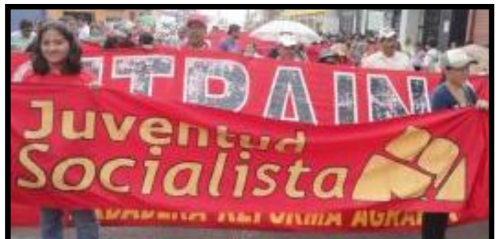
↑ ... en la práctica