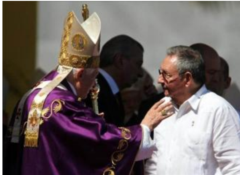
↑ Evitar confrontaciones que desarrollen las contradicciones

Las ventajas para la burocracia de un enfoque que pone tanto énfasis en el control del conflicto están a la vista, aunque el esquema, naturalmente, no carece de riesgos. Ahora bien: ¿por qué la diáspora cubana de Miami debería adoptar este esquema en vez de conti-