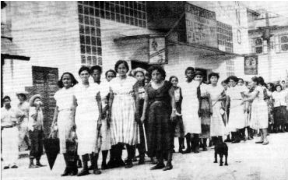
↑ Comité de seguridad integrado por mujeres en la huelga de 1954. El Progreso

pueblo trabajador lo lleve —a través de la movilización permanente y la autodeterminación democrática— a derribar el orden burgués, su estado y su régimen. De la misma forma que se definen las reivindicaciones, demandas y propues-