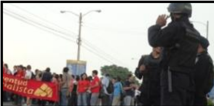
↑ Defendiendo sus derechos en las calles pese a la represión