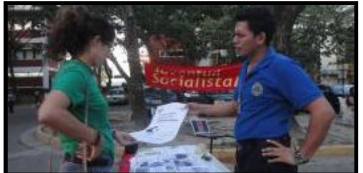
↑ Informando y concientizando