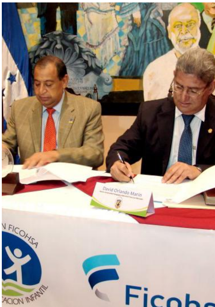
↑ Acuerdos entre la UPNFM y FICOHSA

El debate sobre la educación superior en particular sobre quién debe tener la