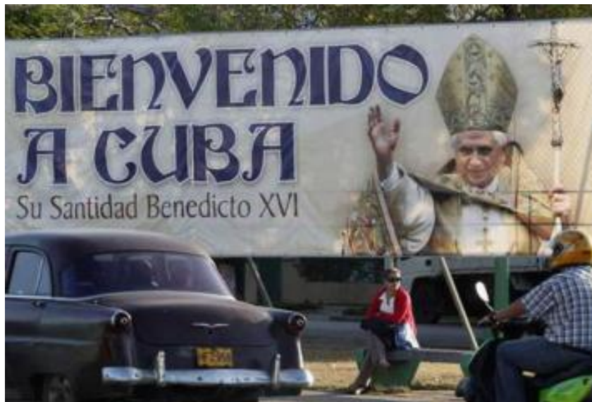
↑ El PCC movió todo su aparato para la visita de Su Santidad

mo. Lo interesante es que ahora la propia burocracia suscribe la afirmación . El punto de la soberanía es innegociable para este esquema de la Iglesia. Entre otras razones, porque sabe que es también no negociable para la mayoría de los cubanos. Esto es lo que le quita todo viso de realidad al gusanerío: suponer