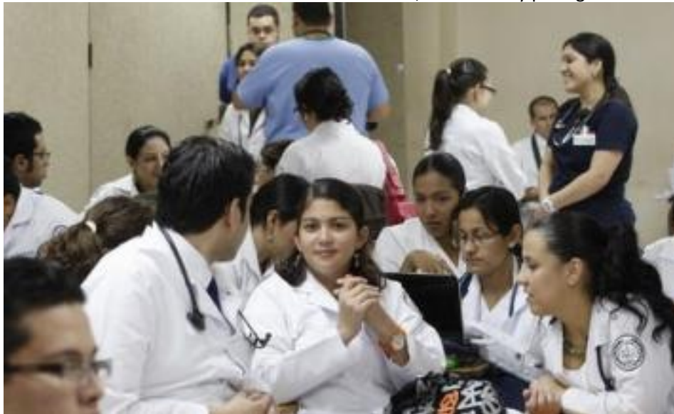
↑ Los médicos internos en huelga

E l año 2011 marcó un bajón en la agitación masiva, generalizada y sistemática –desde el golpe de estado del 28 de junio– que puso contra la espada y la pared al régimen bipartidista, desnudó –para toda la población– las lacras del sistema capitalista hondureño y mostró la posibilidad de un cambio de sistema: la refundación de Honduras.