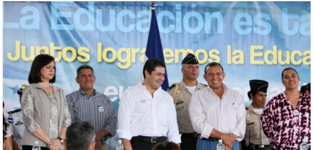
↑ Juan Orlando Hernández y Pepe Lobo logran golpear la educación pública

El ingreso al sistema educativo, la estabilidad laboral, el salario y la jubilación quedan flexibilizados –al igual que lo ocurrido con los trabajadores del sector privado– sujetos a organismos (los llamados Consejos) en donde la empresa privada, las iglesias, los caudillos y activistas políticos, tendrán poder de decisión y ejercerán un sistema de “control” sobre el trabajo docente basado en incentivos y mecanismos de hostigamiento y persecución.