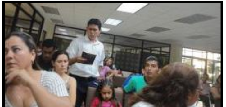
↑ Compartiendo propuestas con el cuerpo docente