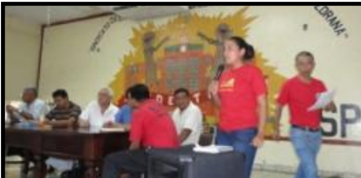
↑ Junto a la clase obrera