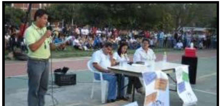
↑ Junto a los colegios magisteriales