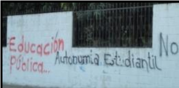
↑ En el corazón de la contrarreforma los estudiantes luchan