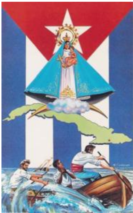
↑ Virgen de la Caridad del Cobre

C on todo esto del viaje del Papa a Cuba me acordaba del título de un extenso libro de Manuel Vázquez Montalbán: “Y Dios entró en la Habana”. El título refería —aunque su contenido iba mucho más allá— a la visita del anterior Papa, Juan Pablo II a la isla caribeña hace 14 años. Y por estos días el enviado de Dios vuelve a entrar a la capital cubana, en medio de un lento pero irreversible proceso de transición al que los medios oficiales y el Gobierno refieren como una “actualización del socialismo”. En un momento donde el propio término socialismo se ha vuelto bastante indefinible, pensar en qué consistiría su actualización no resulta menos enigmático.