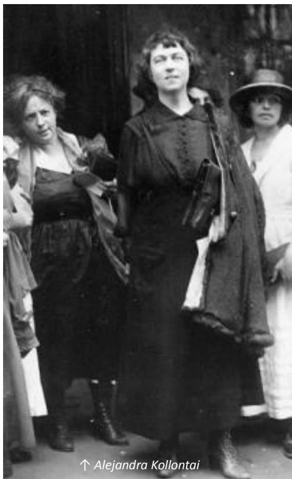
↑ Alejandra Kollontai