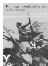
España Revolucionaria 1936-1940