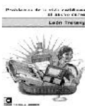
Problemas de la Vida Cotidiana