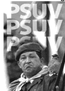
la C-CURA y la UNT.

Frente a la conformación de un partido estatizado hasta la médula, burgués y de encuadramiento (por más «socialista» que se autoproclame), toda «táctica» debe subordinarse a una definición política tajante y clara: no estamos a favor de entrar al PSUV; por el contrario, reivindicamos el pluripartidismo de los partidos de la izquierda y obreros . Es a partir de esta definición política que pueden venir las más variadas (y seguramente necesarias) tácticas para el diálogo con la vanguardia y la base de