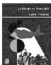
¿Adónde va Francia?