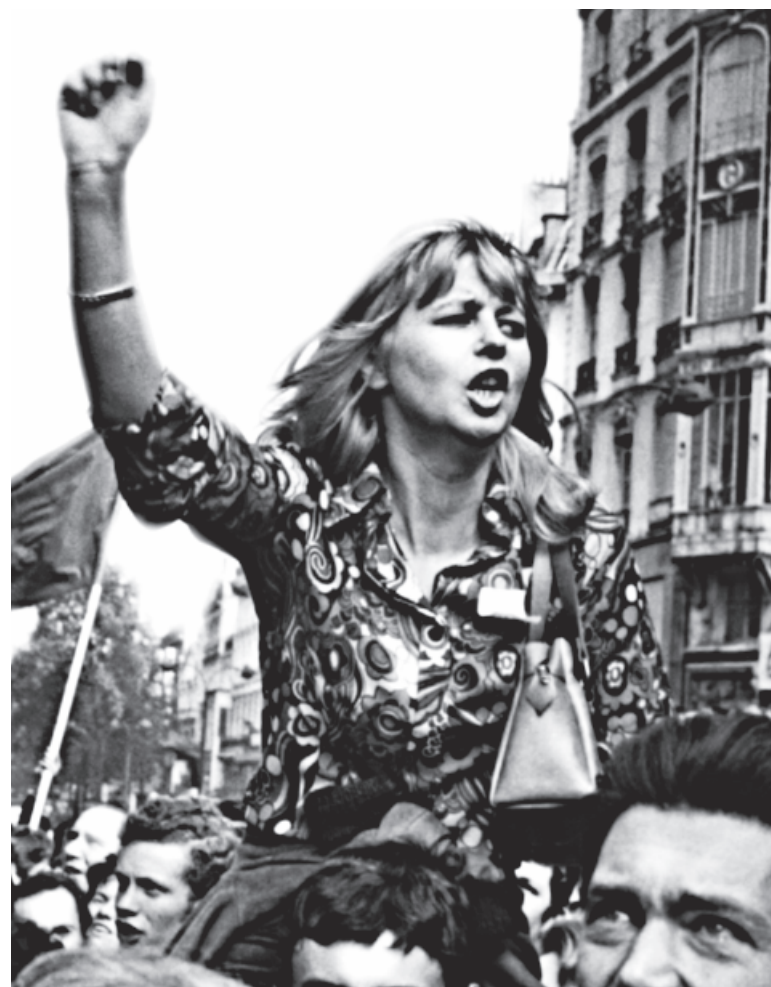
SOCIALISMO, EDUCACIÓN Y UNIVERSIDAD

La tarea de los revolucionarios entre la juventud universitaria es convertir al movimiento estudiantil en uno de lucha, aliado a los trabajadores y el socialismo revolucionario. Pero la única forma de hacerlo es armándolo con un programa propio, que lo vincule con la destrucción de la vieja sociedad y la lucha por una nueva. Las riquezas de la contemporánea fuerza creadora de la humanidad deben ser puestas al servicio de la satisfacción de las aspiraciones sociales, políticas, culturales y deportivas de las nuevas generaciones.