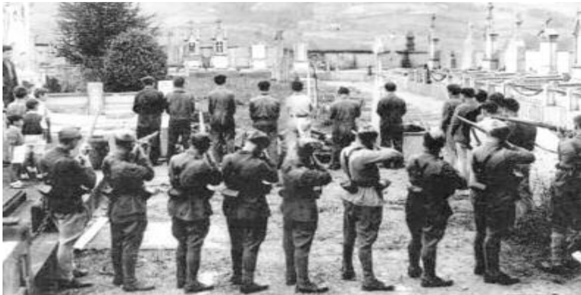
La revolución/guerra civil española se desarrolló en la “era de los extremos” de los años veinte y treinta del siglo XX, cuando la revolución y la contrarrevolución se disputaban el poder en varios países de Europa. En la imagen un pelotón franquista fusilando en un cementerio a un grupo de milicianos republicanos.

La guerra y la revolución fue el “banco de pruebas”, la arena práctica en la que se probó la política verdaderamente revolucionaria, que opuso a Trotsky, que peleaba por una política y programa marxista para España y una alternativa independiente al gobierno de Frente Popular, con el centrismo del POUM y el anarquismo, que lamentablemente terminaron siendo parte del mismo (Nin ministro de Justicia en la Generalitat catalana; varios de los más connotados dirigentes anarquistas como parte del gabinete de ministros a nivel del Estado español).