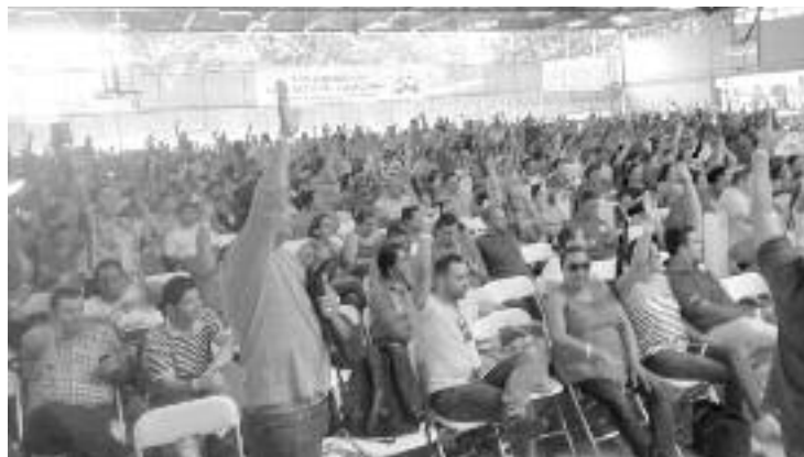
El 22 de abril las bases de la APSE le impusieron a la directiva del sindicato (mayoría del grupo Honestidad) sumarse a la huelga del 26 y 27 de abril.

Desde Profes en Lucha (corriente de discusión en APSE de la cual participan nuestras y nuestros compañeros