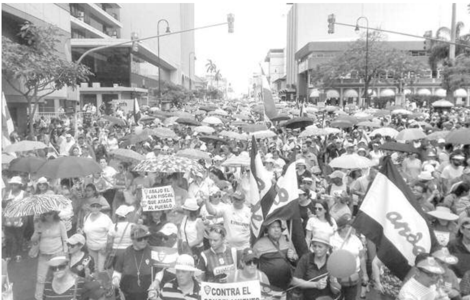
La huelga del 26 y 27 de abril demostró la disposición de las bases sindicales para salir a luchar en defensa de sus salarios contra los ataques del gobierno.

Por otra parte, no deja de sorprender la actitud del gobierno del PAC con respecto a los atropellos laborales en la empresa privada (la dictadura de las patronales”, ver nota en página